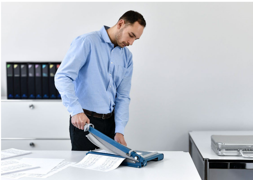
Die neuen Dahle Hebel-Schneidemaschinen der „PRO“ Kategorie eignen sich für Arbeit, Schule, Werkstatt und Studio.