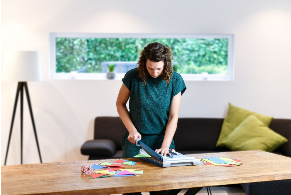
Die „EASY“ Hebelschneider-Modelle von Dahle sind ideal für Haushalt, Hobby und DIY.