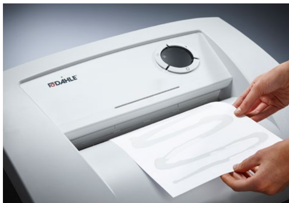
Destruyectora de documentos Waste Dahle 106air