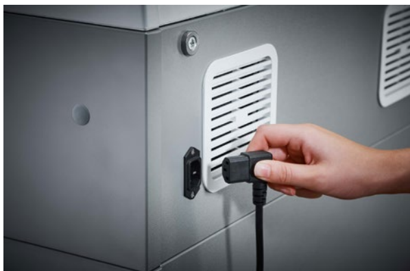
Destructeur de documents Waste 119 Dahle