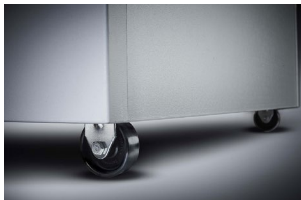
Destructeur de documents Waste 119 Dahle