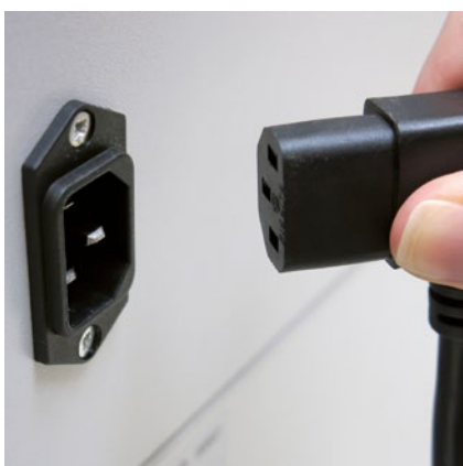
L'alimentation avec fiche d'appareils à froid amovible facilite le déplacement du destructeur