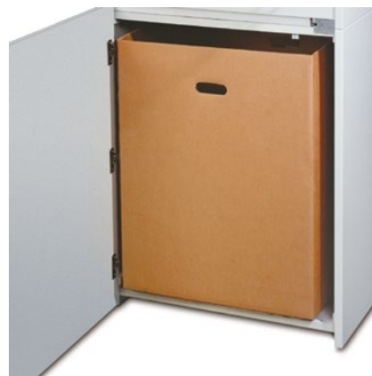
Bac de réception solide pour une utilisation durable sur les modèles 20390 à 20396