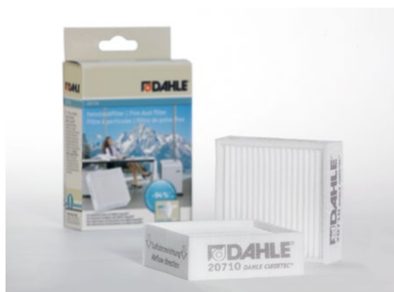
Fines filtres à particules Dahle 20710