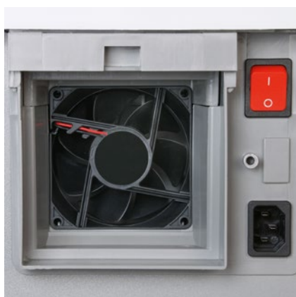
Krachtige ventilator zuigt de fijnstofdeeltjes in de papiervernietiger aan en leidt deze naar het filter