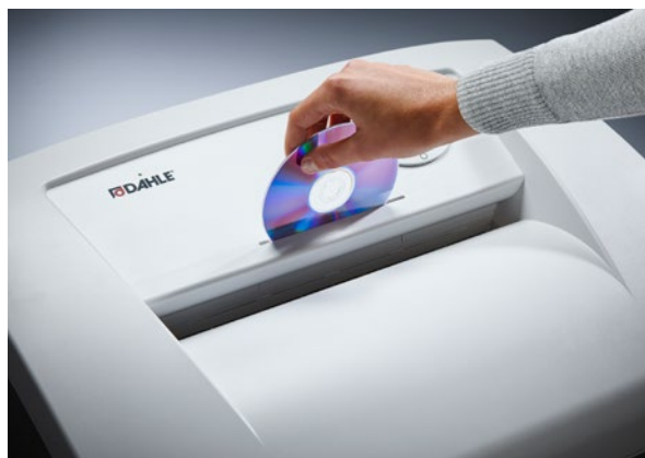
Apart cd-gleuf met eigen opvangbak voor milieuvriendelijke afvalscheiding en veilige vernietiging