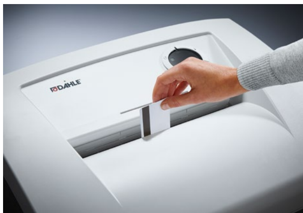
Betrouwbare vernietiging van kaarten