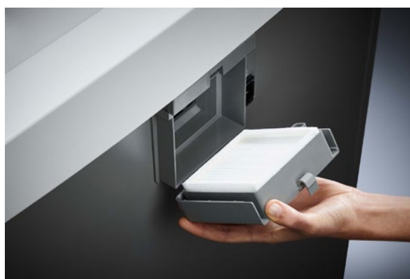
Niszczarka dokumentów Dahle Waste 210air