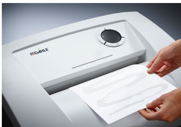
Niszczarka dokumentów Dahle Waste 210air