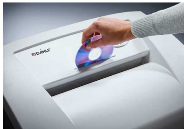
Oddzielny otwór na płyty CD z własnym pojemnikiem na ścinki służący przyjaznej dla środowiska segregacji odpadów i bezpiecznej utylizacji