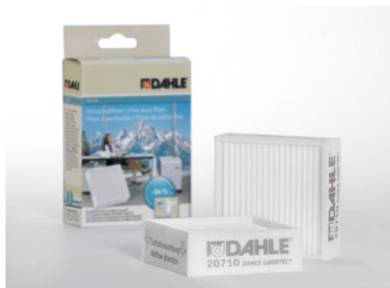
Filtros de partículas finas Dahle 20710