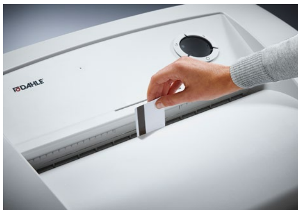
Spolehlivě likviduje karty