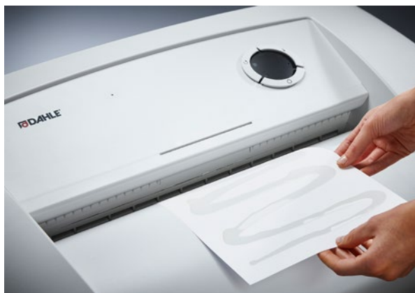
Dahle skartovač Waste 216air