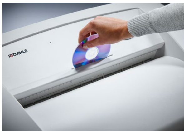
Samostatný slot na CD s vlastním záchytným košem na ekologické třídění odpadů a bezpečnou likvidaci