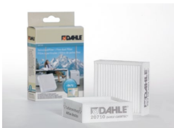
Filtros de partículas finas Dahle 20710