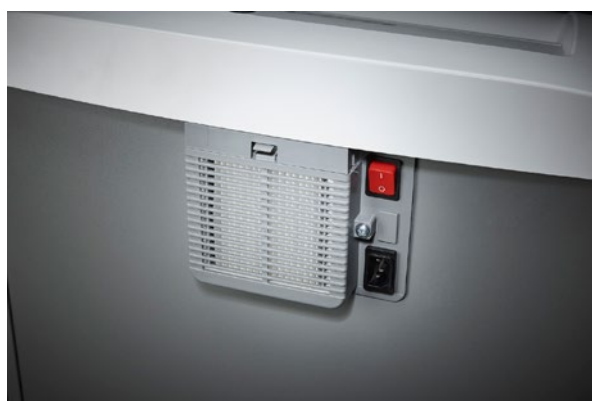
Le interruptor principal independiente en la parte trasera de la destruyectora de documentos permite su desconexión total de la red eléctrica