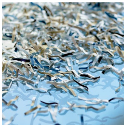
Nivel de seguridad P-5: Recomendado para soportes con datos secretos