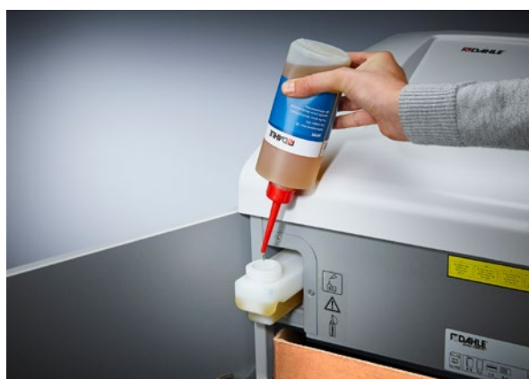
Trituración fiable con engrasado automático: simplemente hay que llenarla de aceite y la destructora de documentos se encarga de todo lo demás