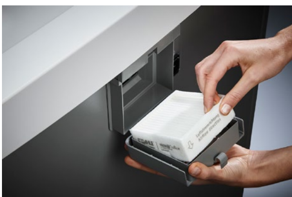
Mejora del ambiente interior a pesar del funcionamiento intensivo: el singular sistema de filtrado DAHLE CleanTEC® reduce la exposición al polvo que genera la destruyectora de documentos