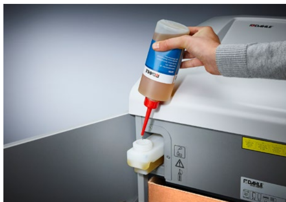
Trituración fiable con engrasado automático: simplemente hay que llenarla de aceite y la destructora de documentos se encarga de todo lo demás