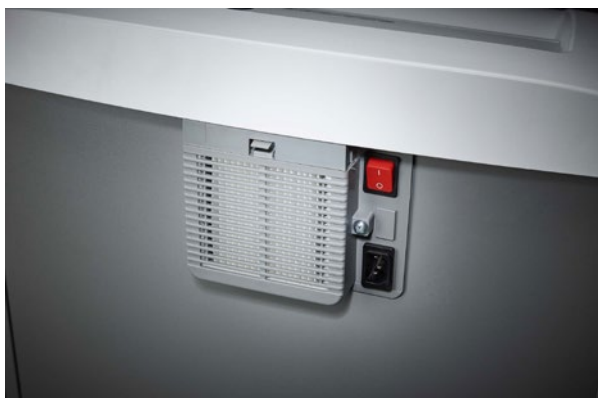
Le interruptor principal independiente en la parte trasera de la destrucciona de documentos permite su desconexion total de la red electrica