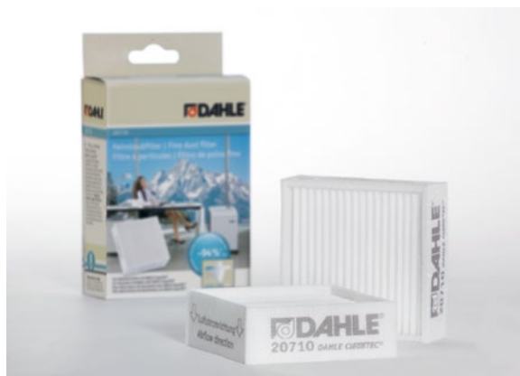
Filtros de partículas finas Dahle 20710