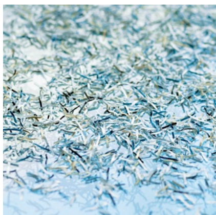
Nivel de seguridad P-6: Recomendado para soportes con datos secretos, cuando hay que cumplir precauciones de seguridad extraordinariamente elevadas