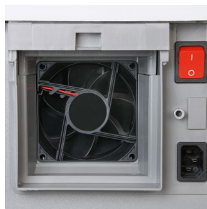
Un ventilador potente aspira las partículas de polvo fino directamente en el interior de la destructora y las transporta al filtro