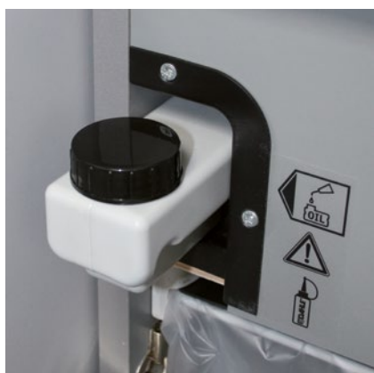
Depósito de aceite integrado para un lubricado automático controlado de los rodillos de corte cruzado que favorece una operatividad más prolongada con un rendimiento constante