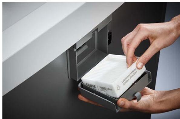
Mejora del ambiente interior a pesar del funcionamiento intensivo: el singular sistema de filtrado DAHLE CleanTEC® reduce la exposicion al polvo que genera la destrucciona de documentos