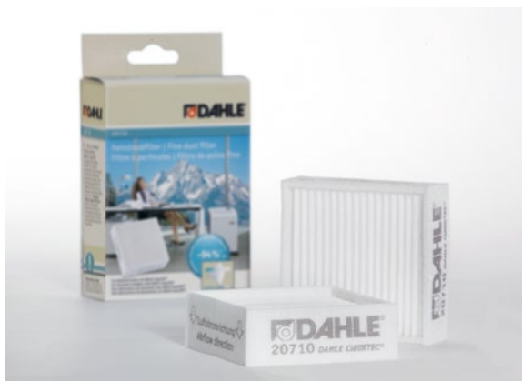
Drobné filtry častiek staých Dahle 20710