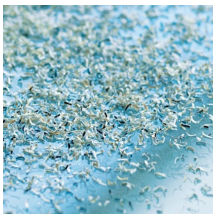
Poziom P-7: Rekomendowane na przykład dla nośników zawierających ściśle tajne dane wymagające zachowania maksymalnych środków bezpieczeństwa