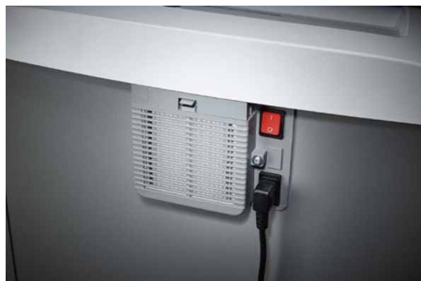
Wyjmowana wtyczka zasilania sprawia że łatwo przenieść niszczarkę z punktu A do punktu B