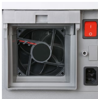
Výkonný ventilátor nasává drobnou částice prachu uvnitř skartovače a odvádí je k filtru